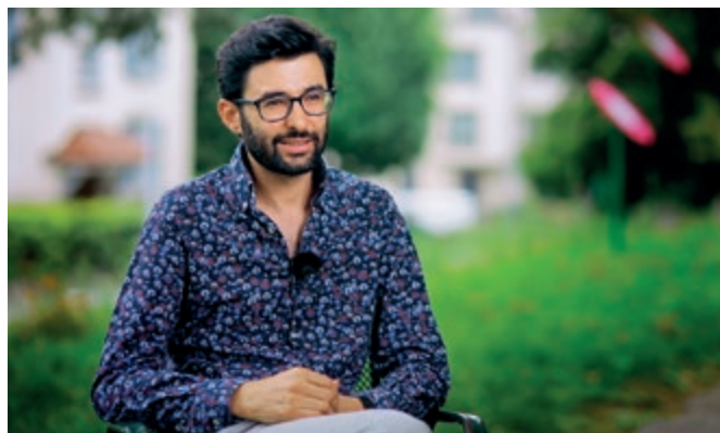
La naissance d'un père recueille le témoignage de dix-huit (futurs) pères.

Ce contact a parfois aussi été révélateur des nouvelles responsabilités à venir: «Beaucoup de joie et une petite sensation d'inconfort en disant "Mon Dieu!" Pas "Mon Dieu qu'est-ce que j'ai fait!" mais "Mon Dieu. Waow! Voilà! Je dois prendre soin de ce bébé, il y a des responsabilités qui arrivent tout d'un coup!" Mais c'est beau comme